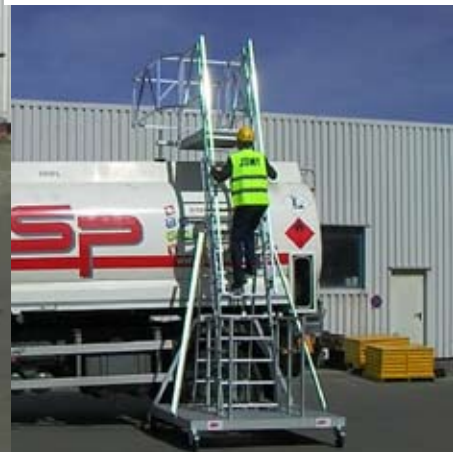
3. Betreden / Klimmen