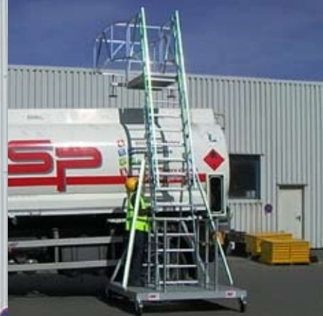
2. Hoogte instellen