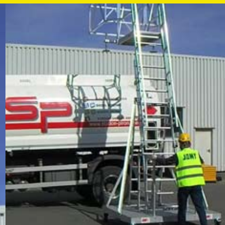
1. Zetten / Op locatie plaatsen